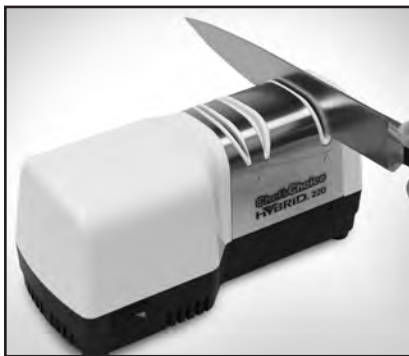
Рисунок 4. Нож в устройстве 2. Совершайте ножом возвратно-поступательные движения, не надавливая на него с чрезмерным усилием, как сказано в инструкции.