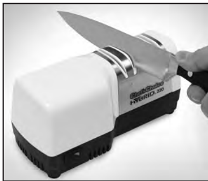
Рисунок 3. Вставьте лезвие ножа в правый паз устройства 1. Сделайте по несколько проходов в каждом из пазов (левом и правом).

Для повторной заточки повторите процедуру, описанную для точильного устройства 2. Сделайте 2-3 полных возвратно-поступательных прохода, сохраняя легкое усилие нажатия. При правильном вращении дисков вы услышите характерный звук. После этого проверьте кромку лезвия на остроту. При необходимости, произведите дополнительную заточку, но сначала проведите лезвие в устройстве 1, после чего уже сделайте 2-3 возвратно-поступательных движения в устройстве номер 2. Обычно освежить остроту лезвия можно в устройстве 2, и только после нескольких раз вам придется вновь воспользоваться устройством 1.