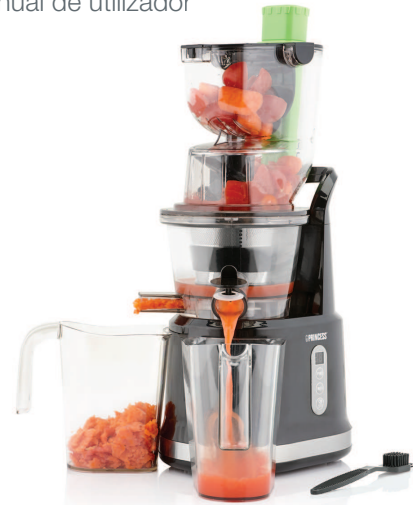
Slow Juicer Easy Fill 01.202045.01.001

PARTS DESCRIPTION / ONDERDELENBESCHRIJVING / DESCRIPTION DES PIÈCES / TELEBESCHREIBUNG / DESCRIPCIÓN DE LAS PIEZAS / DESCRIÇÃO DOS COMPONENTES / DESCRIZIONE DELLE PARTI / BESKRIVNING AV DELAR / OPIS CZĘŚCI / POPIS SOUČÁSTI / POPIS SUČASTI