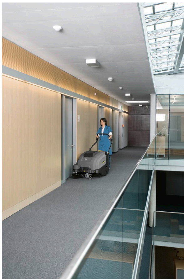
KM 75/40 W Bp Pack