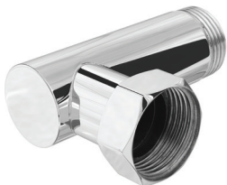
Уголок переходной G 1" НР × 1" НГ арт. 02002-0110