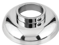
Отражатель декоративный G 1" н/ж «Стилье» арт. 00100-0100