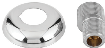
Отражатель с эксцентриком для ПС «Стилье» арт. 00100-3400