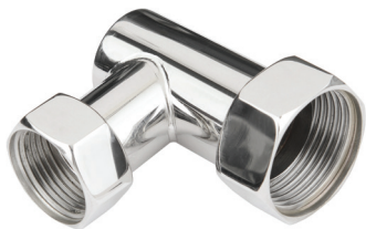
Уголок переходной G 1" НГ × 3/4" НГ арт. 02001-1034

4.4. Для успешной установки данных изделий производитель рекомендует использовать набор комплектующих собственного производства: