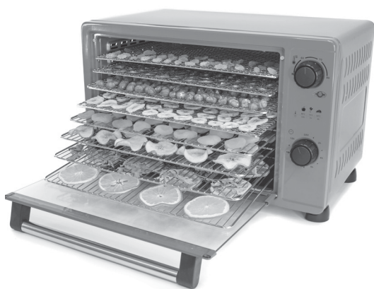
Рисунок 2: Сушилка для фруктов, овощей и трав, 30 л с сухофруктами

ж) Прибор активируется установкой таймера.