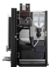
OPTIBEAN 3 (XL) TOUCH