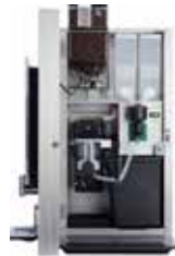
OPTIBEAN 3 (XL)