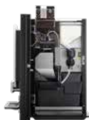
OPTIBEAN 2 (XL) TOUCH