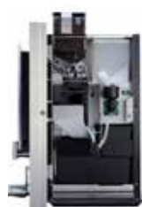
OPTIBEAN 2 (XL)