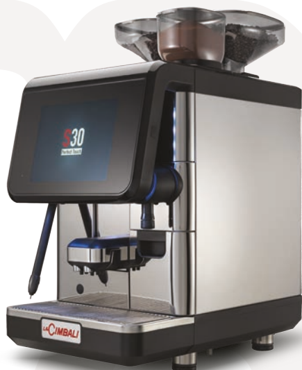
LaCimbali S30 – Vue avant ¾ et arrière