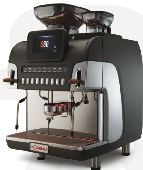
LaCimbali S60 – Vista frontale e di ¾

Une machine intelligente et smart avec télémétrie bidirectionnelle, un contrôle à distance et l'app CUP4YOU.