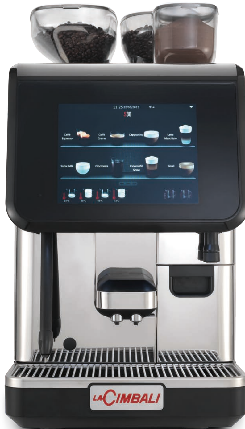
LaCimbali S30 – Vista frontale e di ¾

Une lance vapeur automatique qui permet de configurer 4 recettes à base de lait avec ou sans mousse. Encore plus facile à utiliser et à nettoyer.