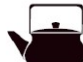
Посуда из сплава с низким содержанием железа