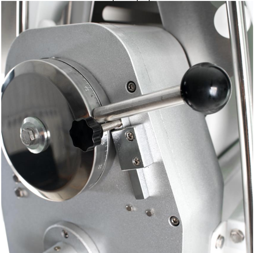
Регулировочный механизм толщины раскатки теста. №7