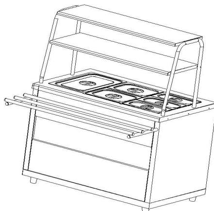
Рис.1 Общий вид мармита МЭП-2Б-П/ЛП-01, МЭП-2Б-П/ЛПЭ

Общий вид мармита представлен на рис. 1. В серии «Ли́ра-Профи» корпус мармита изготовлен из нержавеющей стали, в серии «Ли́ра-Профи Э́ко» отдельные элементы изготовлены из окрашенной оцинкованной стали. В столешницу мармита встроена прямоугольная паровая ванна с электронагревательными элементами.