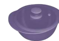
396362 КАСТРЮЛЯ Ø 25см / 2,3л