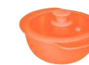
396314 КАСТРЮЛЯ Ø 23.5см / 1,3л