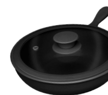
396428 СКОВОРОДА Ø 23.5см / 1,5л