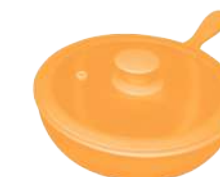
396353 СКОВОРОДА Ø 23.5см / 1,5л