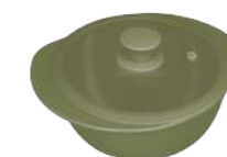
396336 КАСТРЮЛЯ Ø 25см / 2,3л