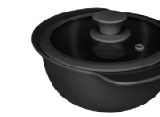
396427 КАСТРЮЛЯ Ø 23.5см / 1,3л