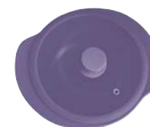
396361 КАСТРЮЛЯ Ø 28.5см / 3,3л