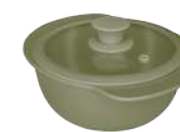
396337 КАСТРЮЛЯ Ø 23.5см / 1,3л