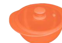
396313 КАСТРЮЛЯ Ø 25см / 2,3л