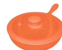
396315 СКОВОРОДА Ø 23.5см / 1,5л