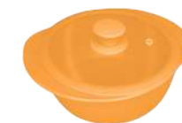
396350 КАСТРЮЛЯ Ø 25см / 2,3л