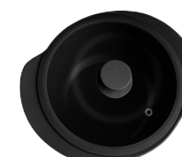
396424 КАСТРЮЛЯ Ø 28.5см / 3,3л