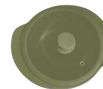
396333 КАСТРЮЛЯ Ø 28.5см / 3,3л