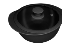
396426 КАСТРЮЛЯ Ø 25см / 2,3л