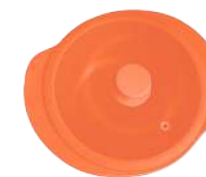
396311 КАСТРЮЛЯ Ø 28.5см / 3,3л