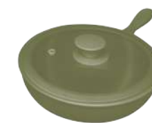
396338 СКОВОРОДА Ø 23.5см / 1,5л