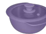
396363 КАСТРЮЛЯ Ø 23.5см / 1,3л