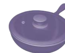
396364 СКОВОРОДА Ø 23.5см / 1,5л