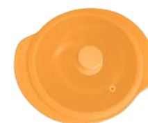
396349 КАСТРЮЛЯ Ø 28.5см / 3,3л