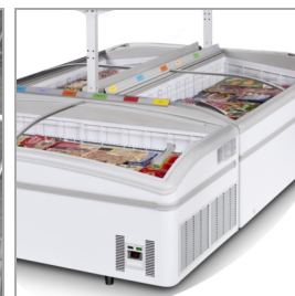
Установка островного типа, полки как принадлежности