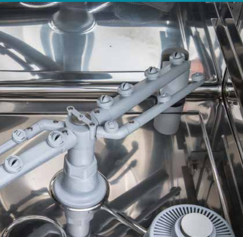
New system of wash and rinse arms - only for DWASH 50

Lavaplatos en acero inoxidable AISI 304, puerta de doble pared. Cuba inclinada con soportes cestas atornillados. Brazos de lavado y aclarado en polipropileno. Dosificador de abrillantador y termostop incluidos. Con botones electromecánicos o teclado a presión sencillo. Opciones: bomba de desagüe y dosificador de detergente.