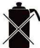
Чайник из алюминия и меди