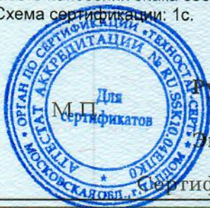
Схема сертификации: 1с.

Место нанесения знака соответствия: на изделии, на упаковке и технической документации.