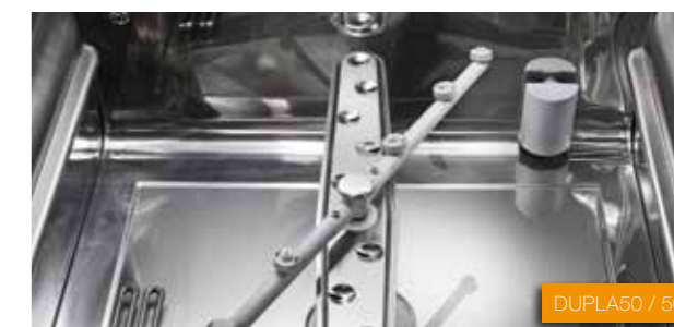
DUPLA50 / 50T