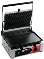
CORT L Timer

- Механический таймер, не входящий в комплект.