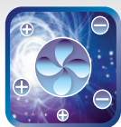
Плазменная очистка воздуха Cold Plasma Ion Generator*

За качество воздуха в помещении отвечает комплексная система фильтрации: включает в себя ULTRA Hi Density фильтр, Silver Ion фильтр, фотокаталитический фильтр и плазменную очистку воздуха Cold Plasma Ion Generator, которая убивает вирусы и нейтрализует токсичные вещества, предотвращает распространение инфекционных заболеваний.