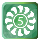
5 скоростей вентилятора внутреннего блока