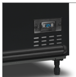
Цифровой пульт управления